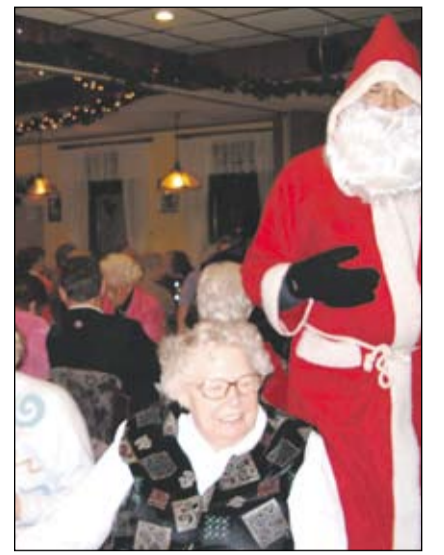
Der Weihnachtsmann besuchte auch den SoVD Geestemünde.