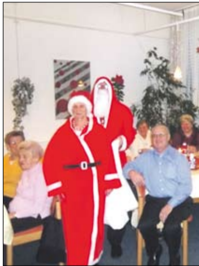
Der Weihnachtsmann und seine Gehilfin besuchten Leherheide.