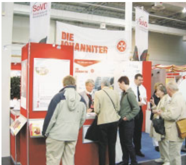
Der Gemeinschaftsstand der Johanniter und des SoVD war bereits von Weitem auf dem großen Ausstellungsgelände der Infa 2003 zu erkennen.