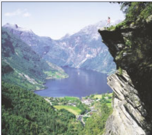
Tiefblaues Meer, grandiose Berge, blitzende Flüsse und begeisternde Kultur: Das neue SoVD-Reiseprogramm ist da!

Wir wünschen Ihnen viel Spaß und Vorfreude beim Durchlesen der Reiseprospekte und freuen uns, Sie als ReisetilnehmerIn begrüßen zu dürfen. Ihr