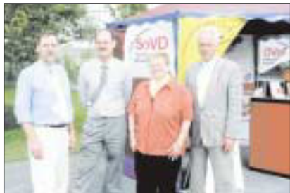
Auf der diesjährigen Landesgartenschau in Wolfsburg prä-