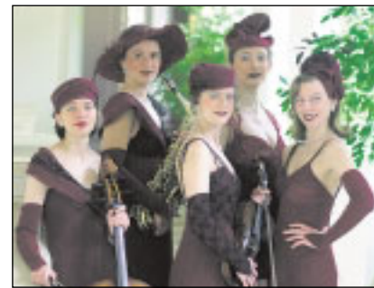
Ausgebildete Konzertmusikerinnen: Die Dresdner Salondamen