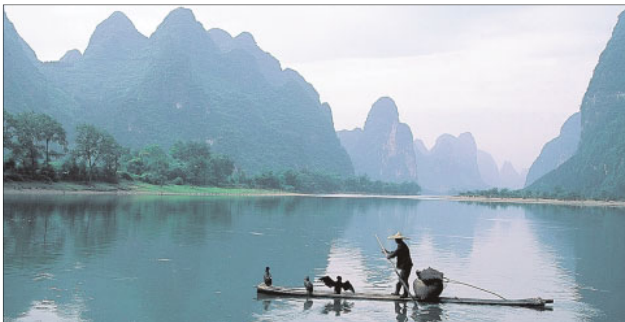
Atemberaubende Landschaften im romantischen China