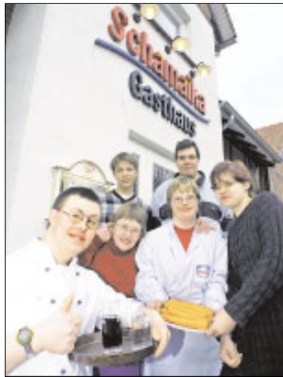
Rundum nett: das Personal im Gästehaus Schamaika

Informationen: Gasthaus Schamaika Teufelsmoorstraße 33 27711 Osterholz-Scharmbeck Tel.: 0 47 96 / 95 18 77 www.schamaika.de