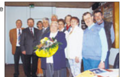
KV Friesland (Varel)