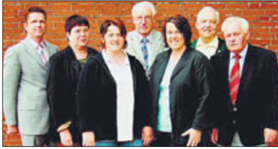
KV Wesermarsch (Brake)