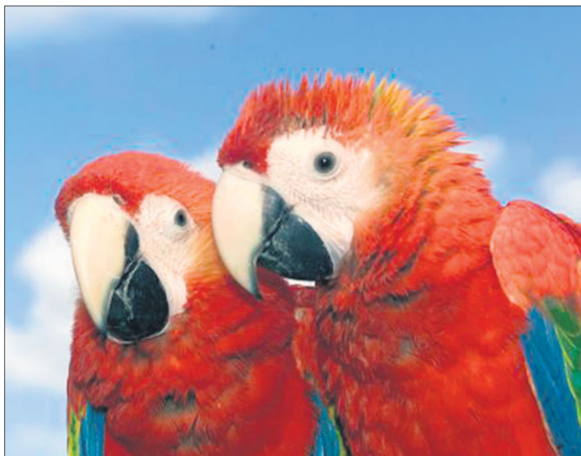
Am 30. Mai 2008 ist SoVD-Tag im Vogelpark Walsrode. Mit etwas Glück erleben die Besucher neben den handzahmen Lori-Papageien vielleicht auch einen waschechten Kondor im Freiflug.

Und wenn dann auf einmal bunte Papageien um die Nase flattern und der Vogelruf ganz nahe klingt, dann befindet man sich mitten in der beliebten Lori-Kontaktvoliere! Hier erleben die Besucher die rund 50 australischen Papageien hautnah und können sie sogar füttern. Ein frisch angerührter Nektar, der für 50 Cent an der Burschänke neben der Uhu-Burg erhältlich ist, macht es möglich,