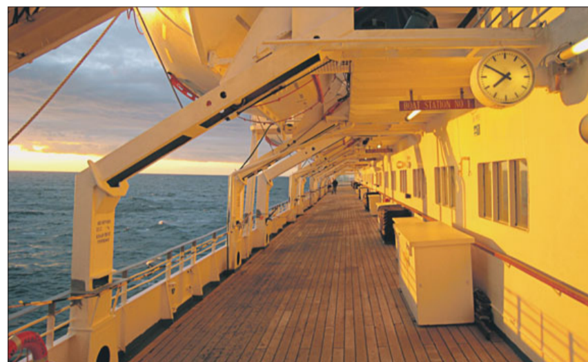
Abenddämmerung auf der MS Albatros vor Norwegen.

Die gemütliche Atmosphäre an Bord, der tolle Service, die leckeren Drei- und Vier-Gänge-Menüs, die verschiedenen Angebote und Ausflugsziele sowie die SoVD-Reisebegleitung haben ihr Übriges dazu getan. Allen Teilnehmenden wird diese Norwegenreise bestimmt lange im Gedächtnis bleiben.