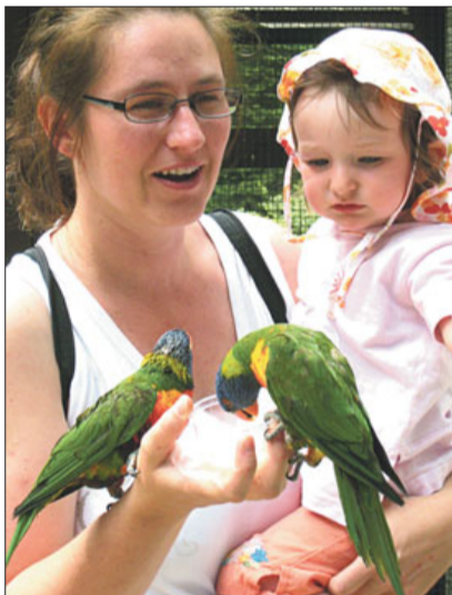
Der Vogelpark Walsrode bietet Spaß für die ganze Familie.

Vogelpark Walsrode Am Rieselbach 29664 Walsrode Tel.: 05161/604419 www.vogelpark-walsrode.de