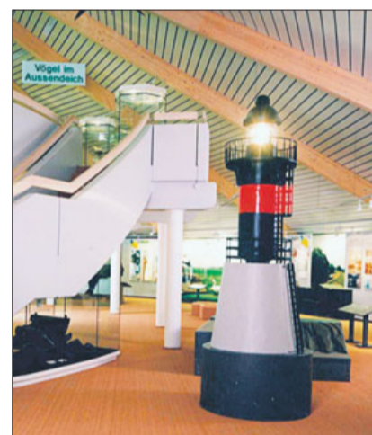
Im Natureum Niederelbe können Sie wechselnde Ausstellungen besuchen.

Grenzlandmuseum e.V. 37441 Bad Sachsa/Tettenborn Tel.: 05523/999773 www.gm-badsachsa.de