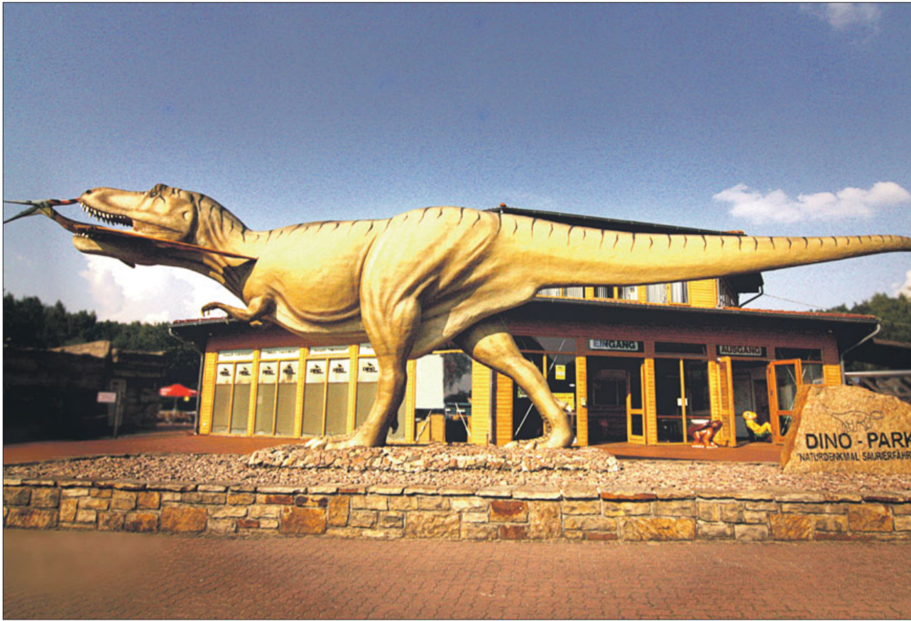
Über 220 lebensgroße Modelle der Giganten der Urzeit können im Dino-Park in Münchheggen bewundert werden.

Der SoVD-Landesverband Niedersachsen sichert das soziale Miteinander nicht nur auf der politischen Ebene, sondern kümmert sich auch im Freizeitbereich um seine Mitglieder. Durch Sondervereinbarungen mit zahlreichen Kooperationspartnern kommen Mitglieder bei Vorlage ihres Mitgliedsausweises in den Genuss von Ermäßigungen.