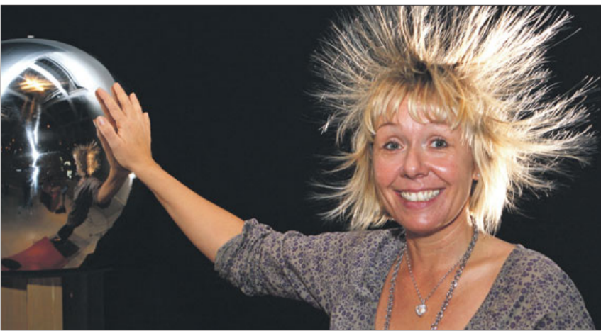
Die zahlreichen Exponate im „Phaeno“ laden zum Mitmachen und Experimentieren ein.

Mit dem Wissenschaftsmuseum „Phaeno“ in Wolfsburg bietet der SoVD-Landesverband Niedersachsen e.V. seit dem 1. April 2010 seinen Mitgliedern einen ganz besonderen Kooperationspartner, der attraktive Eintrittsmäßigungen bereithält. So erhalten SoVD-Mitglieder sowohl auf Einzel- als auch auf Familien- und sogar auf Jahreskarten zehn Prozent Rabatt, wenn sie ihren SoVD-Mitgliedsausweis vorlegen können. So kostet etwa der Eintritt für einen Erwachsenen 10,80 Euro anstatt 12 Euro. Für Kinder bis fünf Jahren ist der Eintritt frei. Das Phaeno entführt seine Besucher in eine erstaunliche Welt: Den oft rätselhaften naturwissenschaftlichen Phänomenen des Alltags können sie in Eigeninitiative auf die Spur kommen. Dabei gibt es viel zu erkunden, zu bestaunen und auszuprobieren. Ein abwechslungsreiches Veranstaltungsprogramm aus Seminaren und Entdeckertouren vermittelt zudem Inhalte, die vernetztes Denken und Handeln fördern. Staunen im Museum bedeutet zum Beispiel: den größten Feuertornado Europas bewundern, DNA analysieren oder einen Blitz in einer Plasmakugel berühren. Verblüffende Experimente für Groß und Klein lassen sich im Phaeno mit der ganzen Familie ausprobieren. Gemeinsam kann man zum Beispiel auf ei-