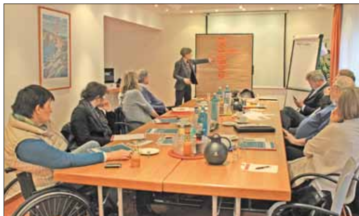
Die Spurguppe hat das weitere Vorgehen besprochen.